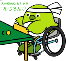
大分県のゆるキャラ めじろん♡