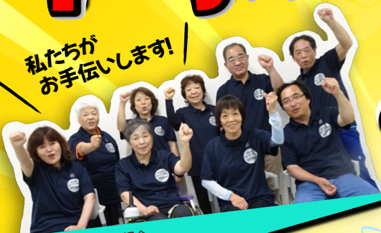
東京北卓球バレー同好会 メンバーのみなさん

卓球バレーの楽しさを一人でも多くの方に 体験していただきたいと、この親睦会を企画しまし た。いつの間にか夢中になり、みんなと仲良くなれる 卓球バレー!一緒に楽しみませんか? お弁当と飲み物をご用意してお待ちしてます!