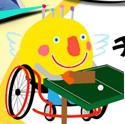
いさぎき茨城ゆめ大会マスコット イバラッキー

6人对6人で、卓球台を囲んで座ります。ネットの下 を通るように、板のラケットで音の出る卓球の玉を打 ち合います。バレーボールのルールが基になっていま す。障害があっても大丈夫!子供からお年寄りまで一 緒に楽しめるスポーツです!椅子からお尻が浮いたら 反則というルールもあります。