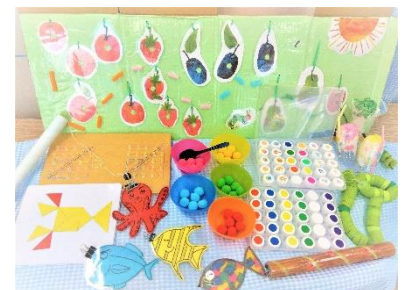
その子の成長や興味に応じて作成をしています。

ベルテールが安心できる居場所になるように児童、保護者、職員との信頼関係を築くことを芯とし、個々の特性に応じた知育玩具、教材を身近なもので作り、できることを少しずつ、ふやしていきます。