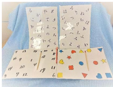
キャラクターや好きな絵柄でチャレンジ。

見る力を養い、視機能の役割の追従、跳飛を楽しく取り組めるように、興味のあるものを使って「見る、見つける、触る」のチームワークがつけられるように目と脳のトレーニングをします。