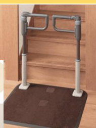
スムーディ〈屋内用〉