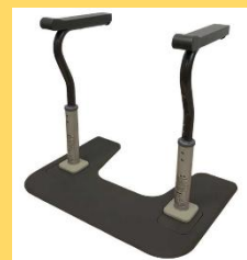
スムーディ〈トイレ用〉