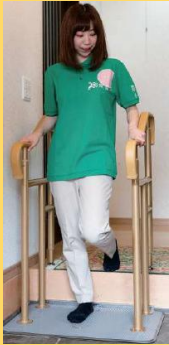
バストサポート手すり