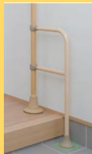
玄関周りの複数オプションや連結の形が体験できる