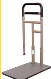
B S小路 (こみち)